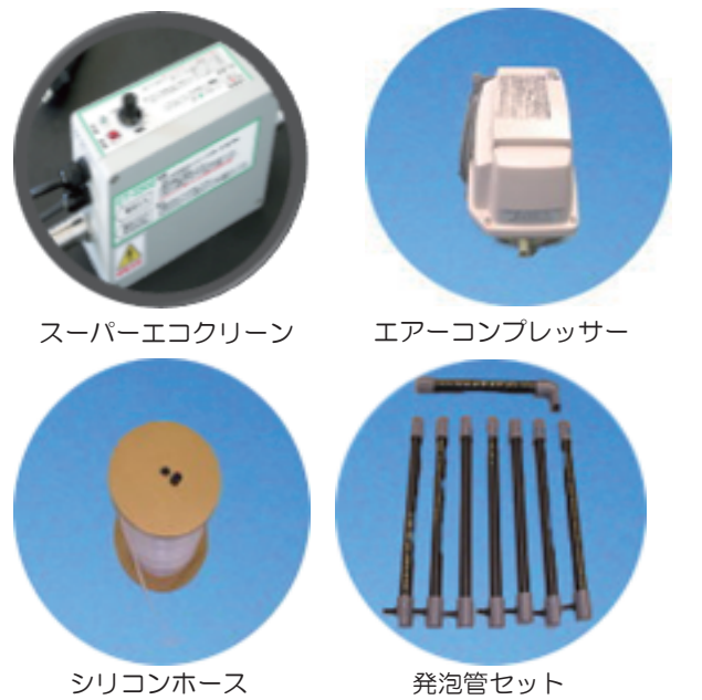
スーパーエコクリーン